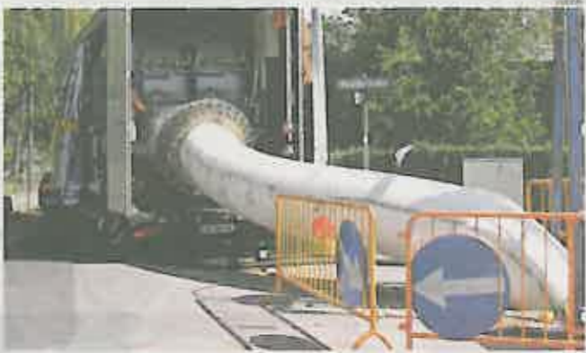
Rabmer Bau ist in acht Ländern Osteuropas aktiv

Nun sondiert Rabmer den Markt in Russland. „Projekte gibt es mehr als genug, die Frage ist immer die Finanzierung“, so Rabmer-Koller. Doch auch in Russland gebe es Gemeinden und Industriebetriebe, die durchaus das Geld für die Errichtung und