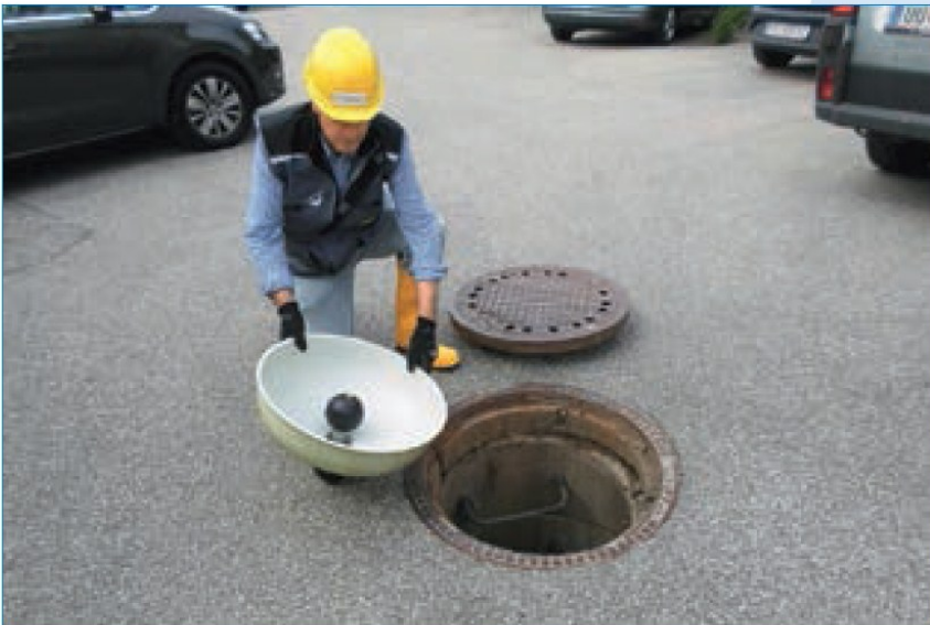
Abbildung 1: Einfache Montage des RGT Geruchsschutz

Für den "RGT-Geruchsschutz" werden qualitativ hochwertige Materialien, wie Glasfaserverbundwerkstoffe beim Gerätekörper oder Spezialtextilien für das Klappensystem eingesetzt. Damit ist der Spezialeinsatz von Rabmer komplett wartungsfrei, säure- und