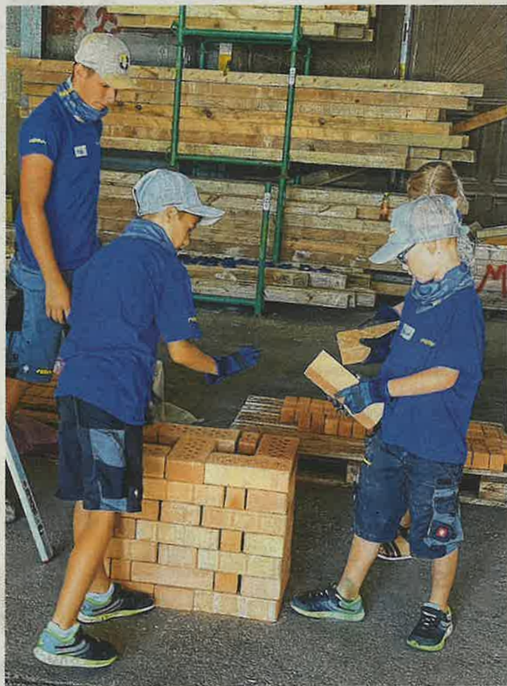
Die Kinder zeigten Engagement und Einsatz.